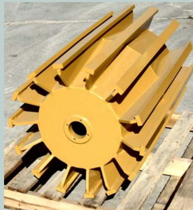
Wing para Trabajo en Canteras