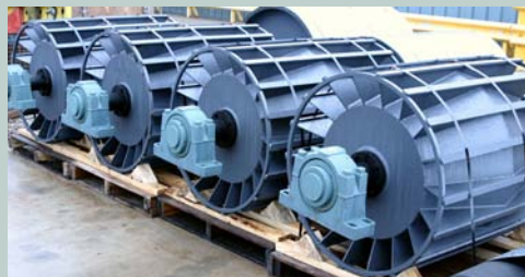
Wing E para Trabajo Pesado