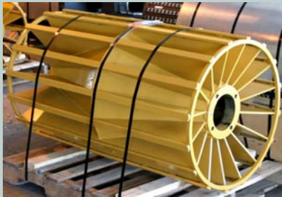
Wing para Trabajo Minero