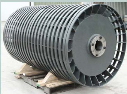
Wing E Espirales