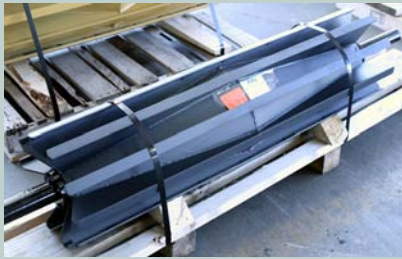
Wing para Trabajo Pesado